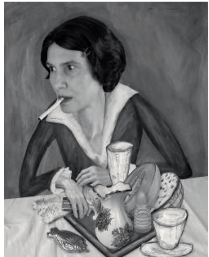
„Contemplation“ inspiriert von Ernst Ludwig Kirchner