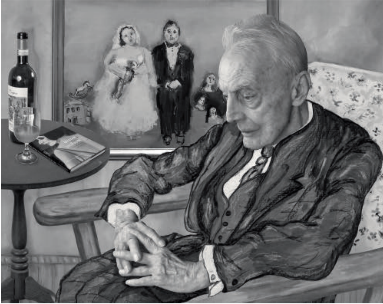
„Vincent“, inspiriert von George Grosz