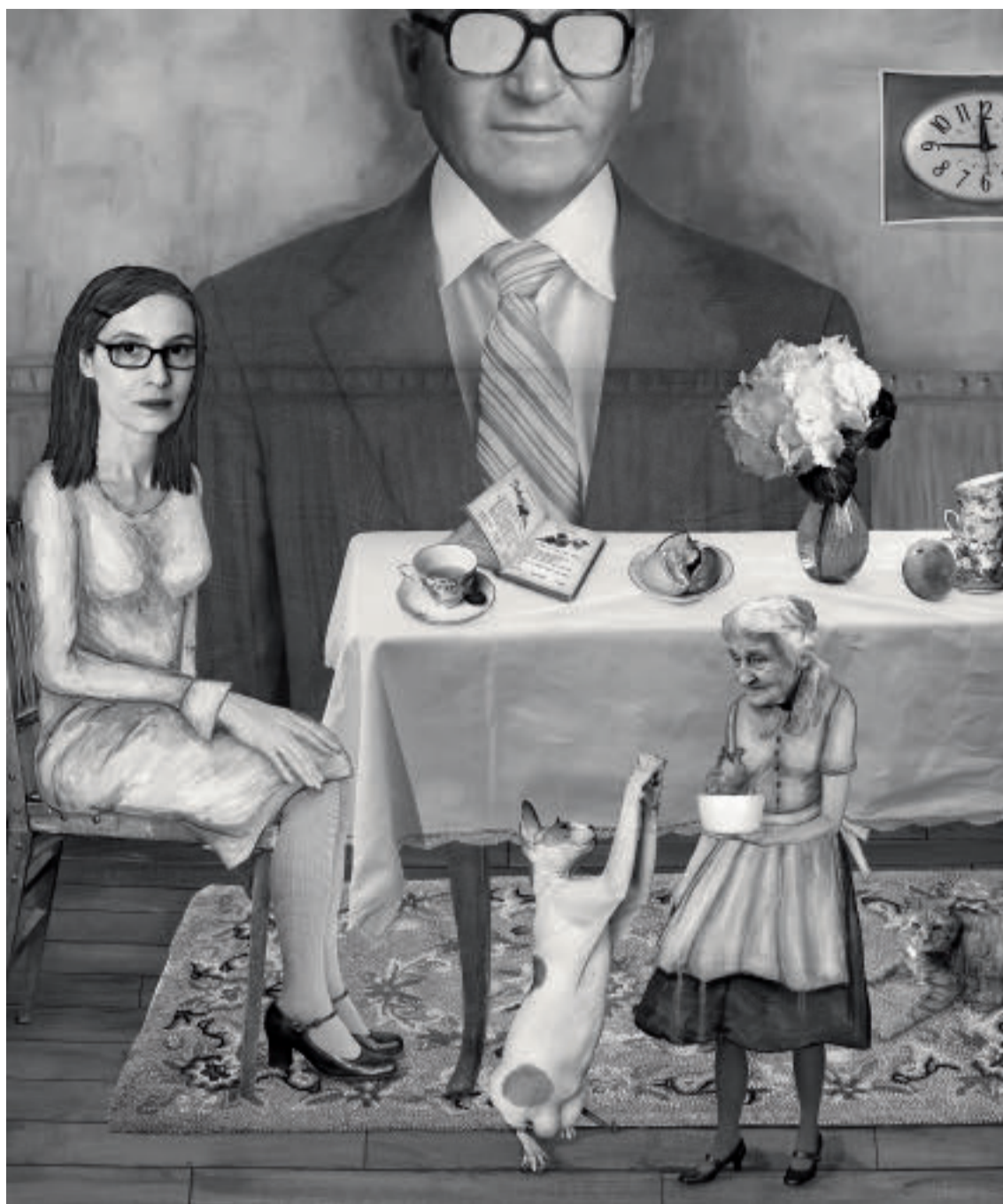
„Family Portrait“, inspiriert von einem Gemälde von Dorothea Tanning. (Papiergröße je 42,5 cm x 55 cm)

Der Titel ihrer neuesten Serie lautet „Hommage“ und vereint Arbeiten, die sich nun wieder intensiver mit der Malerei beschäftigen. Cornelia Hediger kreiert, angelehnt an bekannte Werke der Malerei, ihre ganz eigenen Interpretationen.